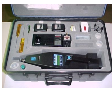
Detector de Explosivos