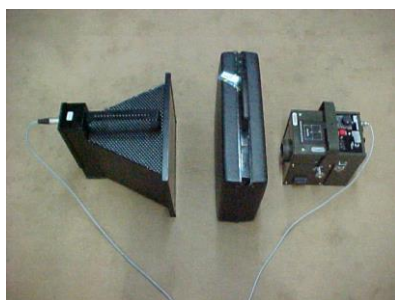
Equipamento de Raio-X, portátil